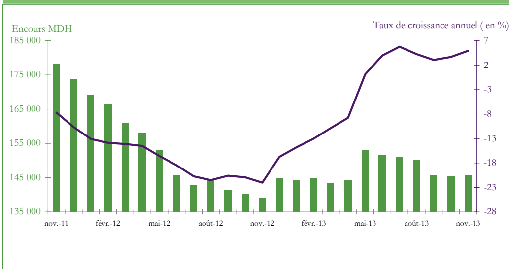
Graphique 3 : EVOLUTION DES RESERVES INTERNATIONALES NETTES